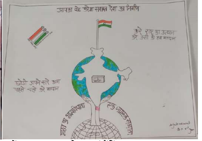
मतदाता जागरूकता के सम्बन्ध में छात्रों द्वारा बनाए गए पोस्टर एवं पेंटिंग