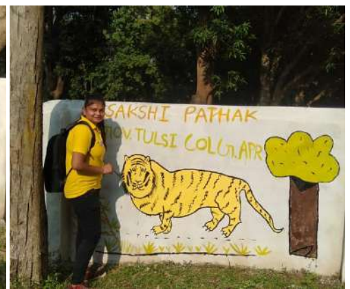
प्रतिभागी छात्र अपने पेंटिंग के साथ