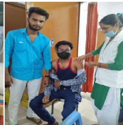
आमलोगों को टीकाकरण केन्द्रों तक लाकर अधिकतम टीकाकरण को सुनिश्चित करते वालंटियर्स