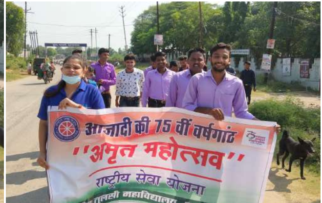
गांधी जयंती के अवसर पर आयोजित मध्य निषेध रैली के सहभागी