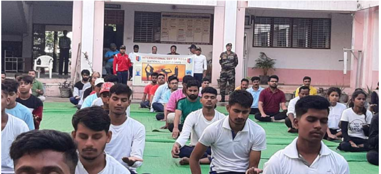
योग अभ्यास करते छात्र छात्राएँ एवं प्रतिभागीगण