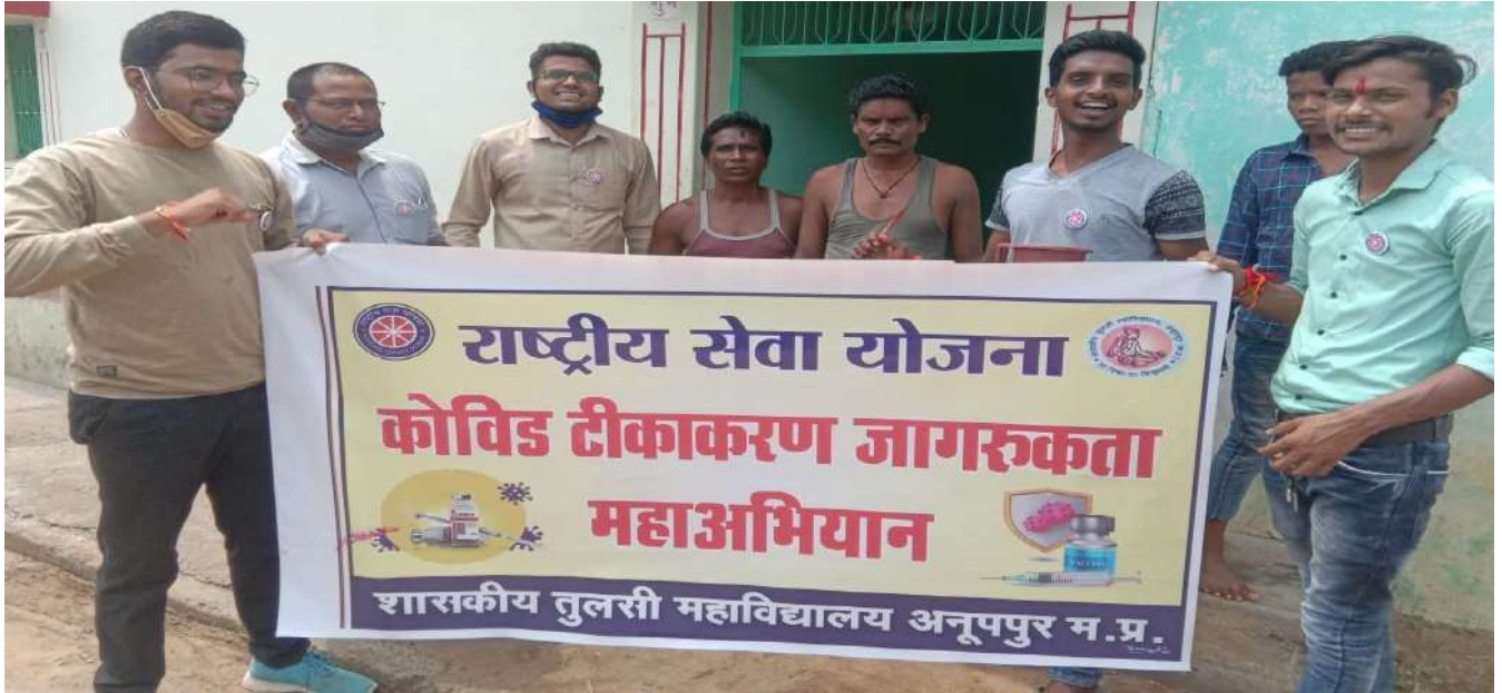
टीकाकरण जागरूकता महाभियान के तहत डोर-टू-डोर सम्पर्क करते रासेयो वालंटियर्स