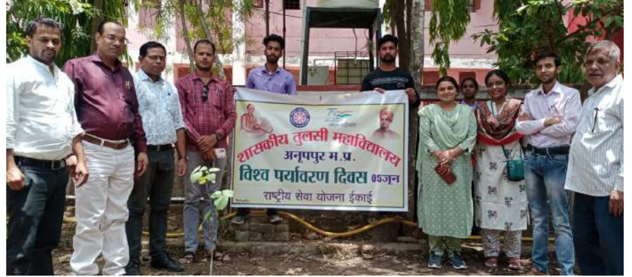
अन्तरराष्ट्रीय पर्यावरण दिवस पर आयोजित विविध कार्यक्रमों के छायाचित्र